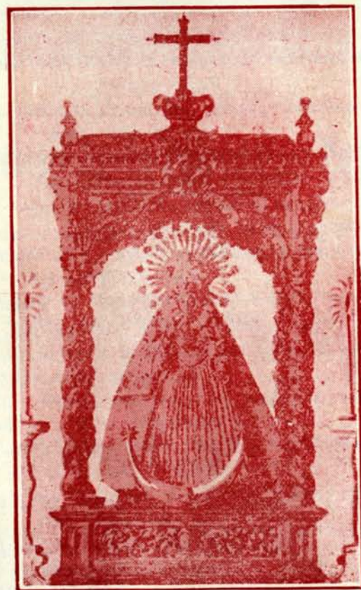
NTRA. SRA. DE PIEDRASANTAS PATRONA DE PEDROCHE