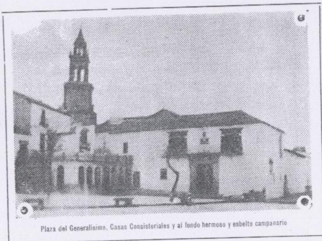
Plaza del Generalísimo. Casas Consistoriales y al fondo hermoso y esbelto campanario