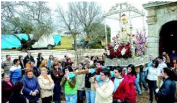
Pedroche La Virgen de Piedrasantas saliendo del santuario.

El Lunes de Pascua a la hermana mayor le corresponde convidar a una comida a todas las mozas, que en el día de ayer se celebró en el pabellón de la caseta municipal. También acudieron los amigos y familiares, como tíos y primos. La hermana mayor vivió ayer su día grande y reconoció que era un honor para ella poder representar a las chicas y disfrutar de este cargo. Este año, debido a la lluvia, la procesión con la Virgen de Guía, presidida por las tres hermanas y con la participación de las autoridades se celebró tras la misa en la parroquia de San Mateo.