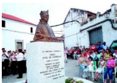
Homenaje Busto del escultor Juan Polo que se ha colocado en Pedroche.