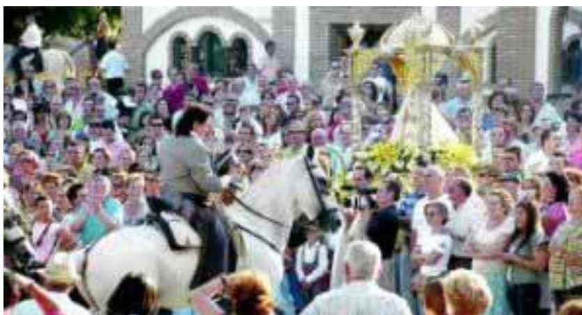
Un momento del traslado de la Virgen de Piedrasantas, patrona de Pedroche, desde la iglesia del Sal

Como cada año por estas fechas, Pedroche celebra una de las romerías más típicas de la provincia, que atraen hasta esta histórica localidad tanto a curiosos por saber qué son los piostros , como a participantes en la fiesta.