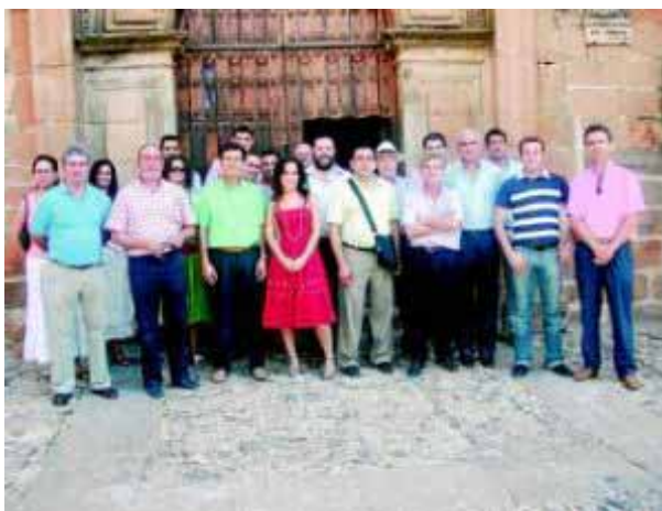
Representantes de los municipios en la localidad jiennense de Baños de la Encina.

La localidad jiennense de Baños de la Encina ha acogido una asamblea extraordinaria de la asociación Red de Conjuntos Históricos y Arquitectura Popular de Andalucía, a la que pertenecen 16 pueblos de Córdoba, Huelva, Jaén y Almería. De nuestra provincia están representados los municipios de Montoro, Bujalance, Dos Torres y Pedroche.