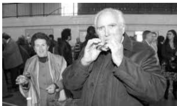
Manjar Las chuletas triunfaron entre los asistentes.