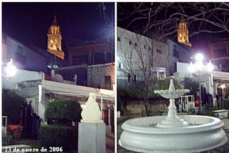
Una imagen vale más que mil palabras

2. "una construcción que se está edificando de forma contigua a la casa consistorial y que por la altura que se le está dando impide la visión de la torre parroquial"