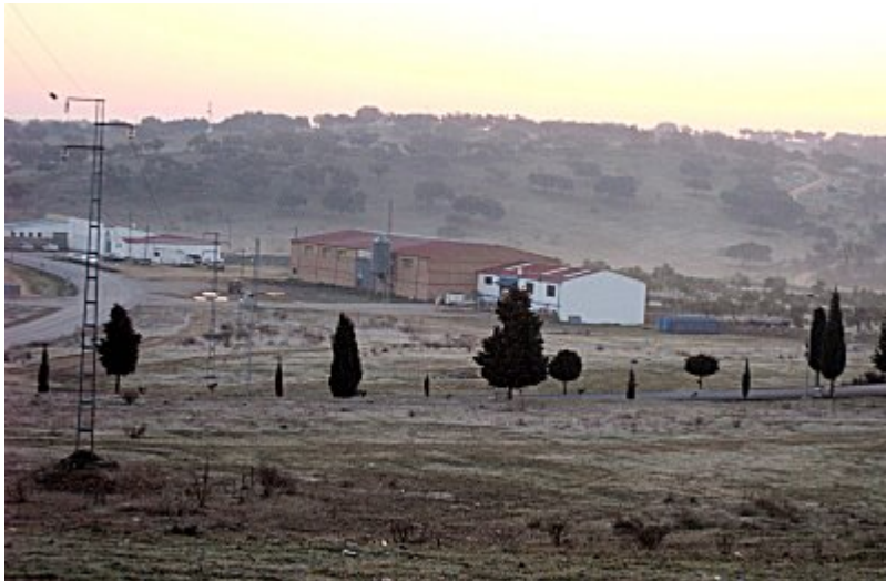
Foto realizada hoy de la zona que se destinará al Polígono Industrial