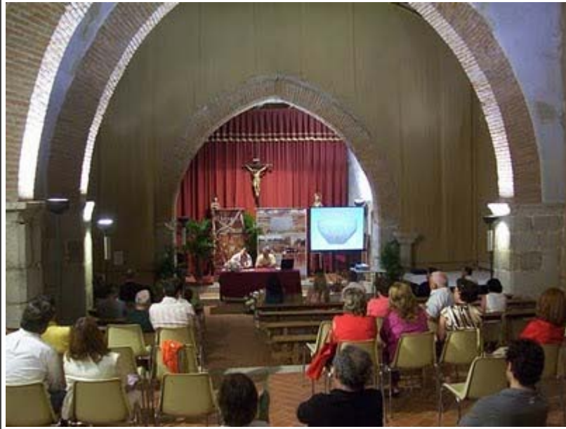
Vista de la ermita de Santa María del Castillo durante una de las ponencias.

satisfacción del trabajo bien hecho, aunque en ocasiones no se haya visto compensado con la asistencia masiva que merecía la convocatoria. De nuevo, la calidad de los ponentes y el interés de los temas abordados han permitido un avance sustancial en el conocimiento de la historia de Pedroche y de Los Pedroches. Al igual que hizo el alcalde, emplazamos y animamos al concejal de Turismo, responsable de la organización de las Jornadas, a preparar las terceras, en la seguridad de que muchos aspectos de nuestro pasado andan esperando aún su ocasión para ser desentrañados, analizados y divulgados, y con el convencimiento de que esta labor, aunque no produzca réditos a corto plazo, será muy apreciada en el futuro.