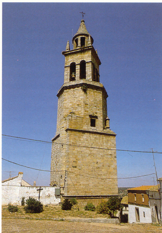
297. Pedroche. Iglesia de la Transfiguración. Torre.

La iglesia tiene dos capillas, la Capilla Bautismal y la Capilla del Sagrario. Esta última, en la nave izquierda, es de planta cuadrada y está cubierta por una cúpula sobre pechinas decoradas con yeserías, y linterna, de finales del siglo XVIII. La capilla Bautismal, situada en la nave