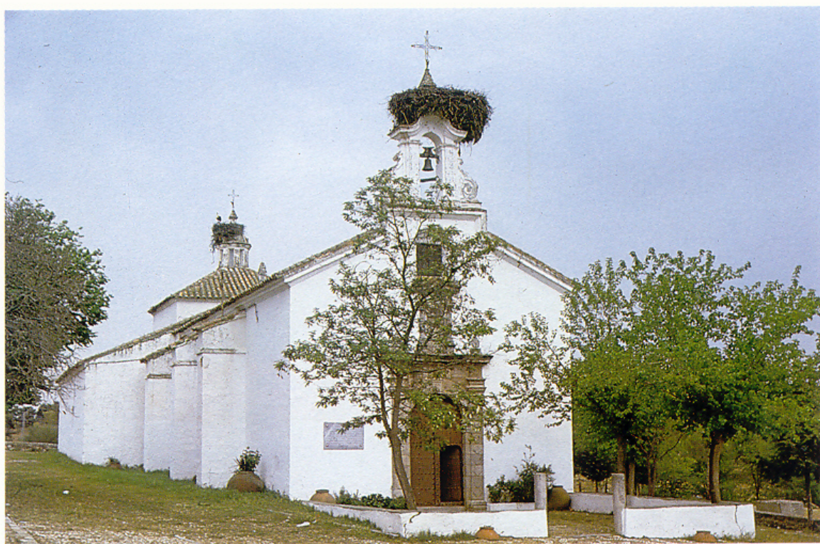
299. Pedroche. Ermita de Piedras Santas.