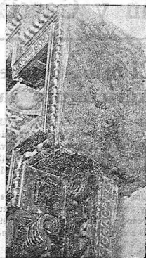
Guadameci en la iglesia de El Guíjo. Se recordaba los detalles de la excursión.