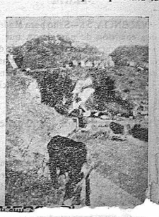
El Anfiteatro de Mérida

Pero en la iglesia de Pedroche se ha perpetrado un atentado más grave. Hay en la sacristía una alhacena forrada con tablas donde se arrinconaban libros y objetos distintos.