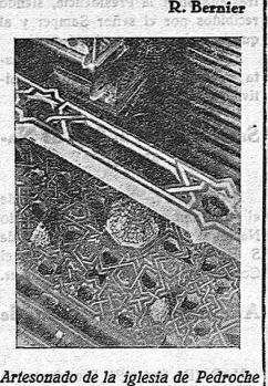
Artesonado de la iglesia de Pedroche