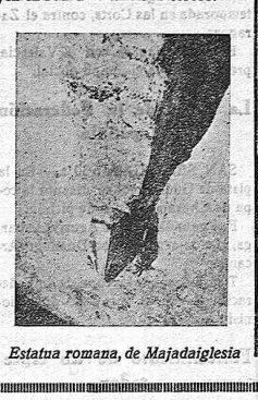
Estatua romana, de Majadaiglesia

Por aquellos lugares se descubren gran número de ruinas de construcciones romanas; se descubren desgraciadamente, porque las gentes, con su afán de riquezas (aquí justificado, pues sus vidas miserables sólo conocen el trabajo rudo y el hambre) las destruyen en busca del ansiado tesoro.