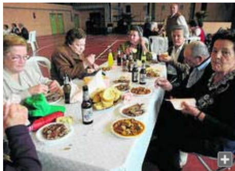
Algunos de los asistentes disfrutaron de las chuletas a la parrilla y la caldereta de cordero.