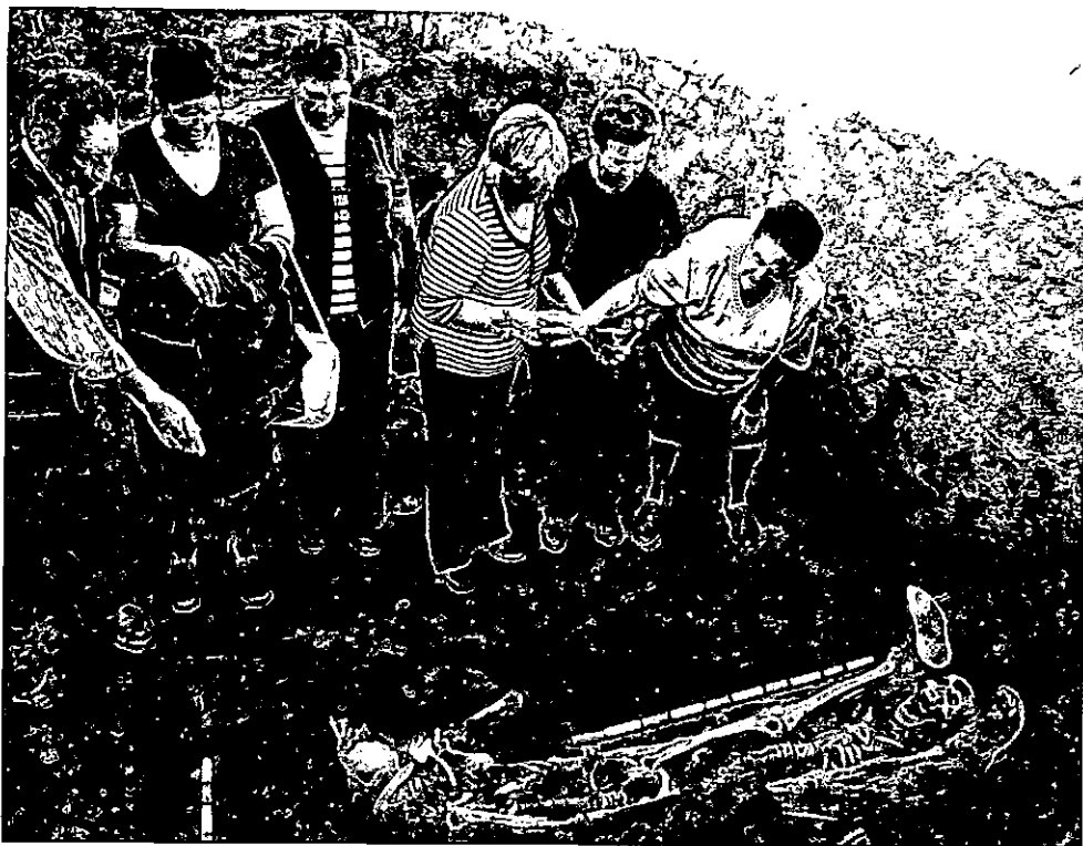
Exhumación de restos de presuntos maquis en Pedroche.

militante del PCE en la clandestinidad, era guerrillero y como tal formaba parte de un grupo que actuaba en el Valle del Guadiato. Fue capturado el 21 de octubre del año 1949, tras ser envenenado, y fusilado un día después. Su cuerpo lo arrojaron a una fosa común en el cementerio de Belmez, junto a dos compañeros.