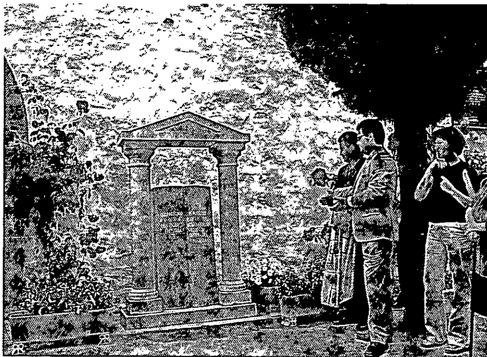
Monumento a las víctimas de la Guerra Civil en Pedroche