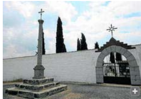
Entrada del cementerio, con la cruz y el arco del convento.

Daba buena cuenta Fray Andrés de Guadalupe en Historia de la Santa Providencia de los Ángeles , en 1662, del fervor que los habitantes de Pedroche rendían a los frailes de la Custodia de los Ángeles durante los primeros años del siglo XVI. Tal era la devoción, que los pedrocheños pidieron al sumo pontífice Julio Segundo su bendición y licencia para erigir un monasterio.