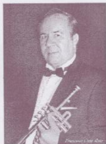
Compositor y catedrático de trompeta por el Conservatorio Superior de Música de Sevilla